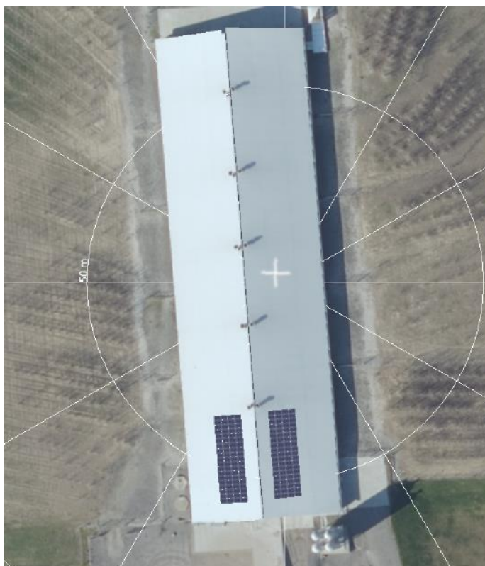
Billedet viser placeringen af solcellerne på bygning