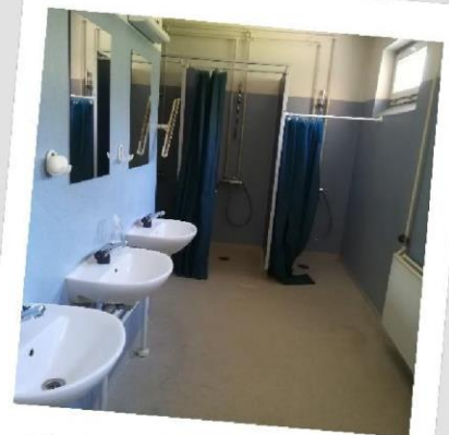
Toilet- og baderum