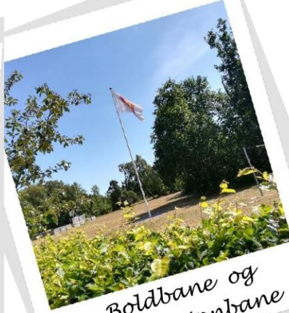
Boldbane og badmintonbane