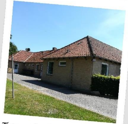
Tørreplads bag lejren