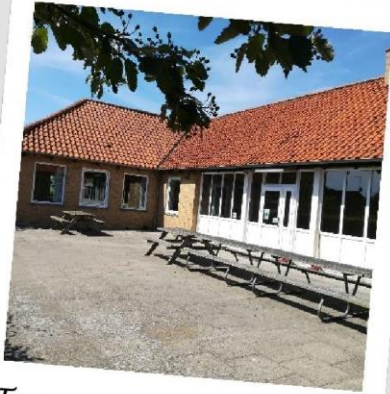
Terrassen foran lejren