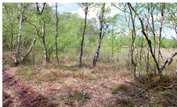
HORREBY LYNG PÅ FALSTER.

Det forventes, at Bruxelles-baserede og mere fagorienterede programmer fx Horizon 2020, Sundhedsprogrammet og Intelligent Energy Europe i højere grad vil levere EU støtte til kommunens større udviklingsprojekter. Det forventes også, at kommunens fagcentre på velfærdsområderne i højere grad vil indgå som partnere i sådanne EU-støttede projekter.