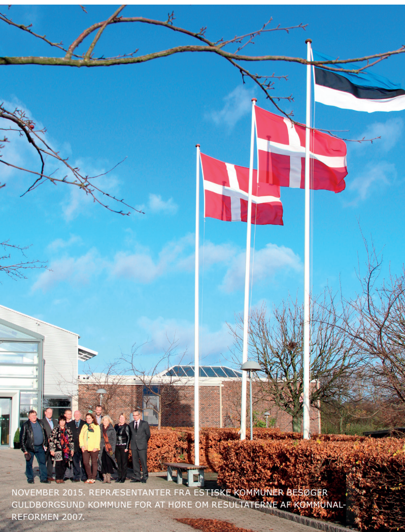
NOVEMBER 2015. REPRÆSENTANTER FRA ESTISKE KOMMUNER BESØGER GULDBORGSUND KOMMUNE FOR AT HØRE OM RESULTATERNE AF KOMMUNAL- REFORMEN 2007.