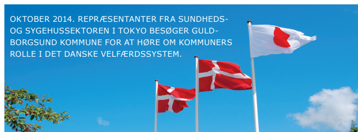
OKTOBER 2014. REPRÆSENTANTER FRA SUNDHEDS- OG SYGEHUSSEKTØREN I TOKYO BESØGER GULDBORGSUND KOMMUNE FOR AT HØRE OM KOMMUNERS ROLLE I DET DANSKE VELFÆRDSSYSTEM.