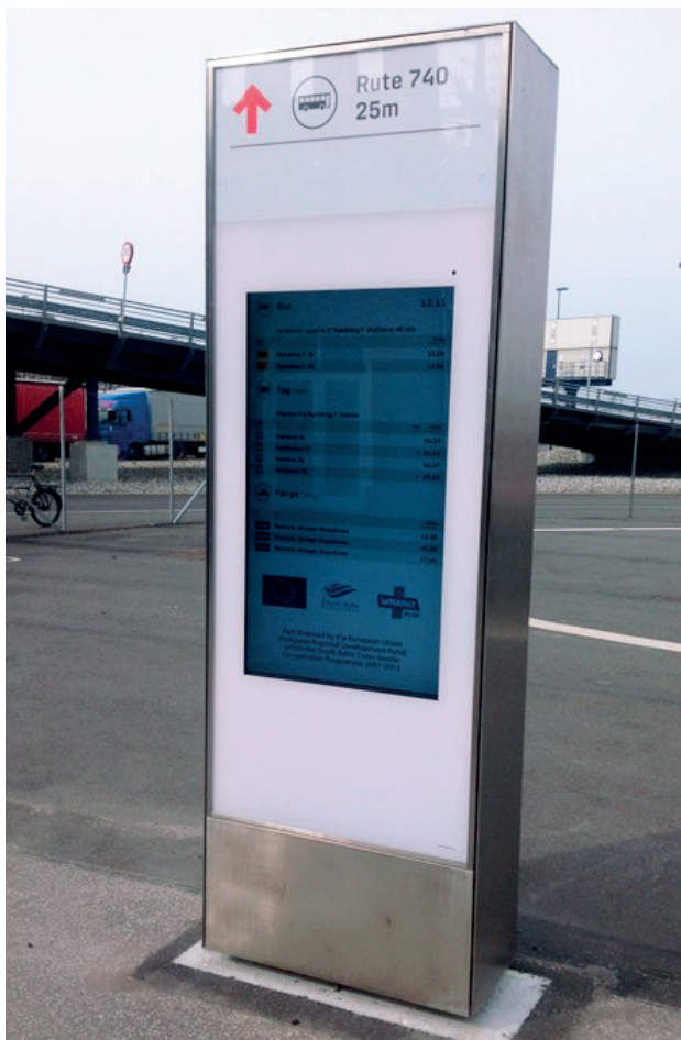
EU PROJEKTET INTERFACE PLUS. PROJEKTET HAR ETABLERET EN SAMLET REJSEFORBINDELSE ROSTOCK – NYKØBING F. SKILT MED REALTIDSINFORMATION PÅ GEDSER FÆRGEHAVN.

Projekterne medvirker både til udvikling af nye serviceydelser til borgerne, og til at give kommunens medarbejdere nye metoder og redskaber til løsninger af daglige opgaver og til hjemhentning af ny viden. Endelig er projekterne med til at markedsføre Guldborgsund Kommune, både i indland og udland.