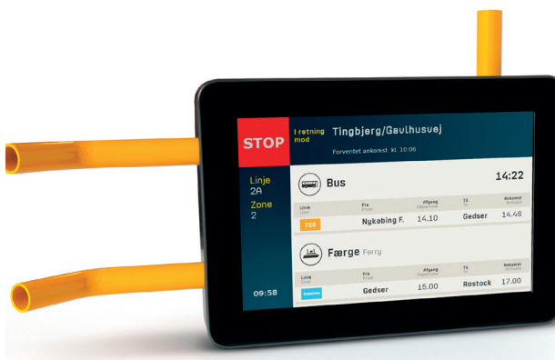
SKILT MED REALTIDSINFORMATION I BUSSEN NYKØBING F – GEDSER.