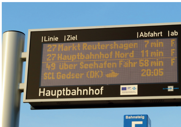
SKILT MED REALTIDSINFORMATION I ROSTOCK CENTRUM.