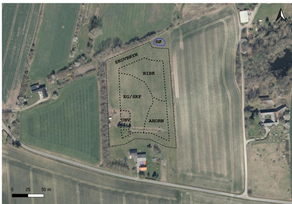
Udarbejdet af Naturplant ApS – Skovrejsningen er indtegnet på ejendommen på luftfoto