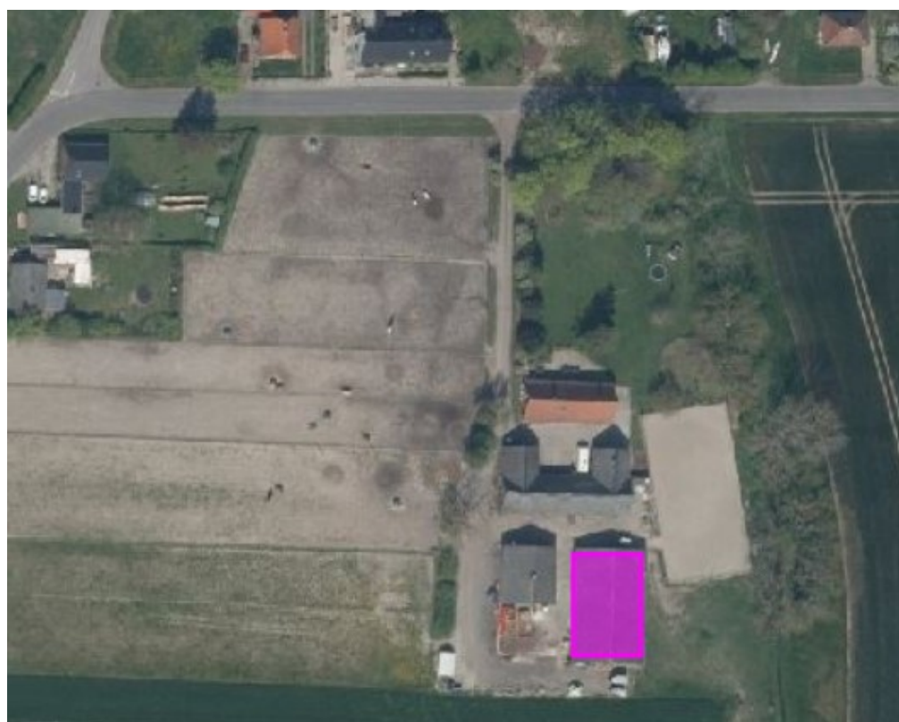
Ridehusets placering er markeret med lilla firkant.