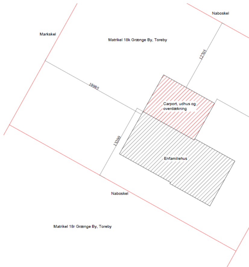
Billedet viser situationsplan over bygningerne