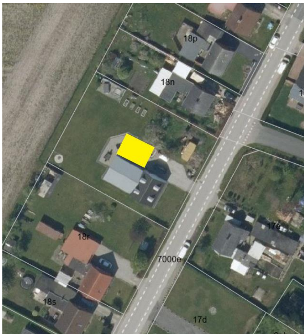
Placeringen af det ansøgte er markeret med gult