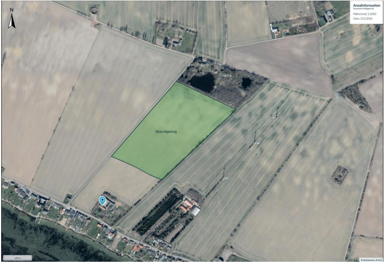
Detalkort 2. Kortbilag fra anmeldelsen.