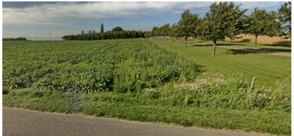
Ejendommen set fra vejen.

Det er vurderet at det ansøgte ikke vil påvirke det omkringliggende landskab væsentligt.