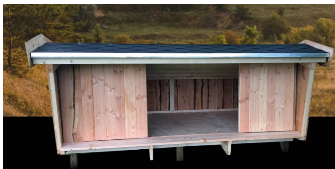
Tre shelters som denne

Vandhuller markeret med lysblå, er der meddelt særskilt landzonetilladelse til.