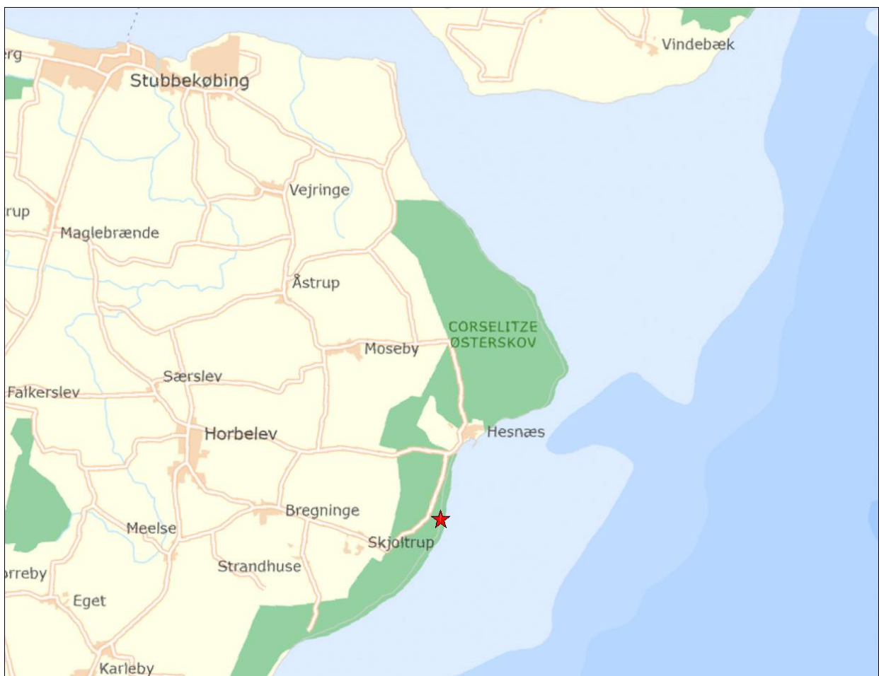
Det ansøgte kystbeskyttelses anlæg er angivet med rød stjerne.