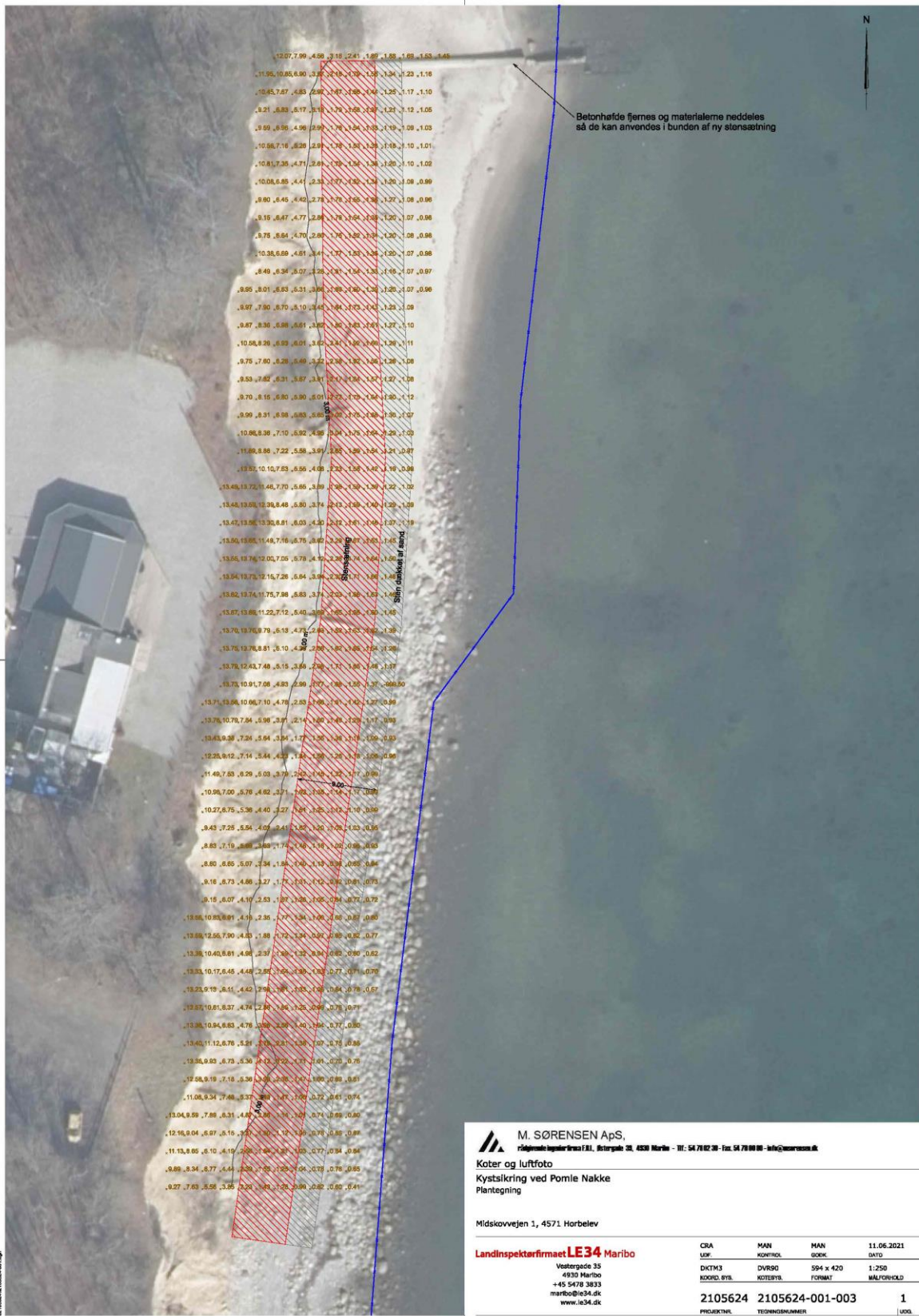
Det ansøgte kystbeskyttelses anlæg er angivet med rød skravering – udført af Rådgiver.