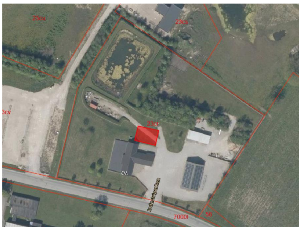
Det ansøgte er markeret med rød firkant.