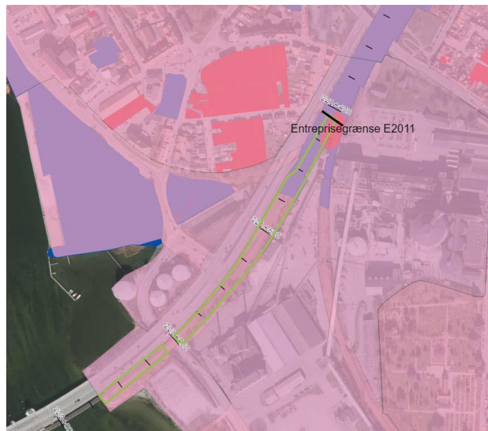
Figur 2: Afgrænsning af anlægsprojektet er vist med grøn streg. Områdeklassificeret jord, V1 og V2 kortlagte arealer er vist med henholdsvis lyserød, blå og rød markering

Nærmeste vandboring (se figur 3) er indvinding til Industri/procesvand på matr.nr.: 648a. Nykøbing F. Bygrunde. Boringen har DGUnr.: 238.500, og befinder sig i en afstand af ca. 140 m fra § 19 området.