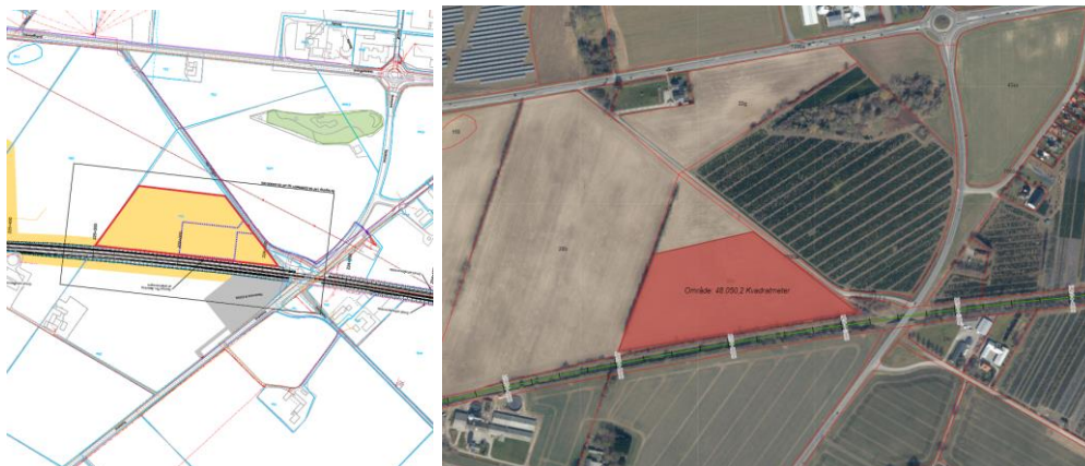
Figur 1: Arbejdsplads ved Nystedvej markeret med rød polygon

Arbejdspladsen planlægges anvendt til skurby, ligesom den skal anvendes til opbevaring og håndtering af: