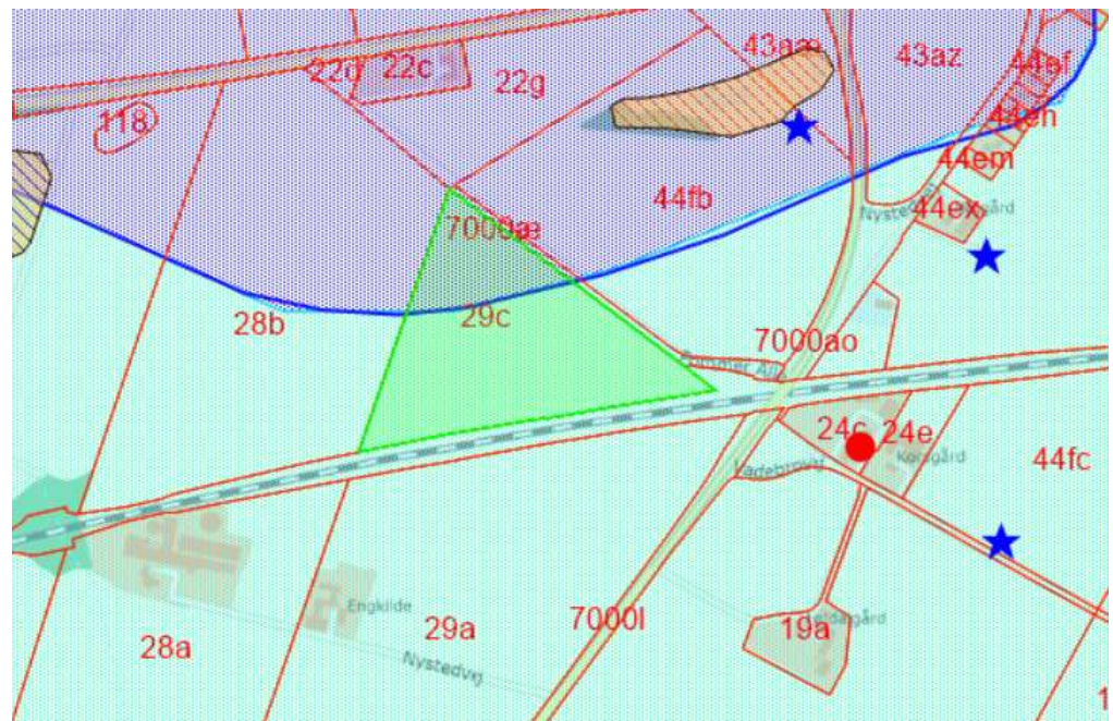
Figur 2: Kort med matrikel 29c Toreby By, Toreby markeret. Arbejdsarealet er beliggende inden for OD (turkis skravering), og nærmeste indvindingsboring med DGU-nr. 237.356 markeret med rød prik.

Nærmeste vandboring er vandforsyningsboring til markvanding/gartneri på matr.nr. 24c, Toreby By, Toreby. Boringen har DGU-nr. 237.356 og er lokaliseret ≤190 m fra den ansøgte §19-plads.