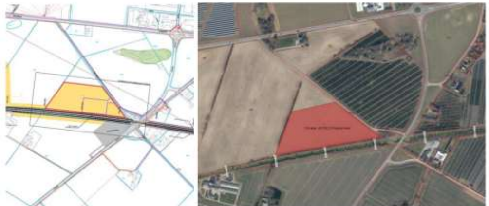
Figur 1: Indretning af byggeplads. § 19-pladsen anrettes inden for område markeret med rødt.

TELEFONTIDER MAN – ONS KL. 9.00 – 15.00 TORS KL. 9.00 – 17.00 FRE KL. 9.00 – 12.00