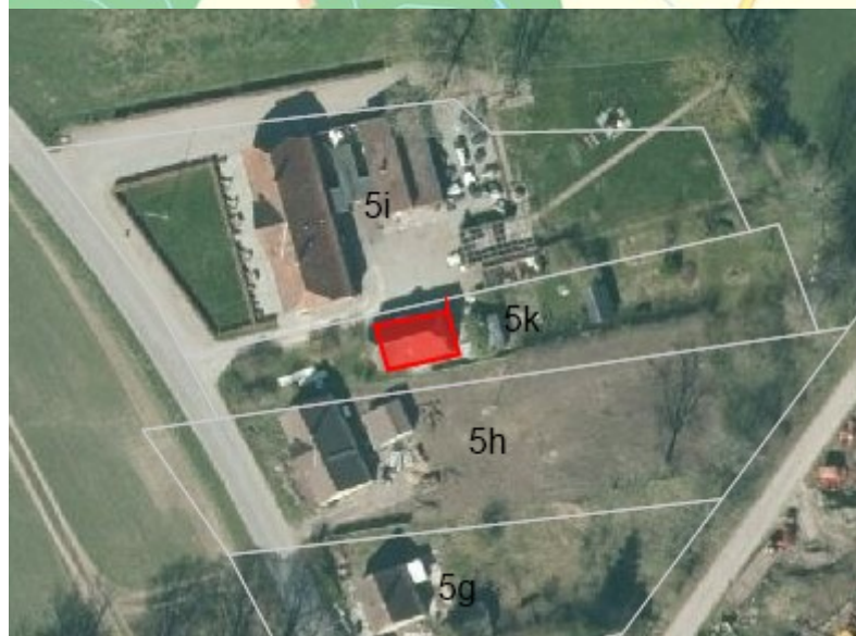
Bygningens placering er markeret med rød