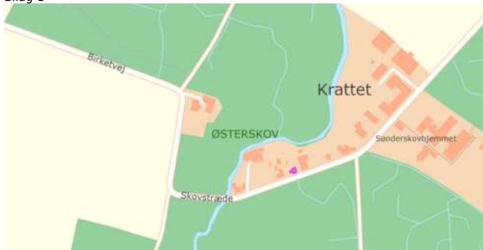
Ejendommens placering er vist med lilla