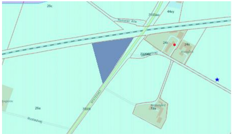
Figur 3: Kort med Banedanmarks arbejdsareal (grå markering). Arbejdsarealet er beliggende inden for OD (tyrkis skravering), og nærmeste indvindingsboring med DGU-nr. 237.356 markeret med rød prik.