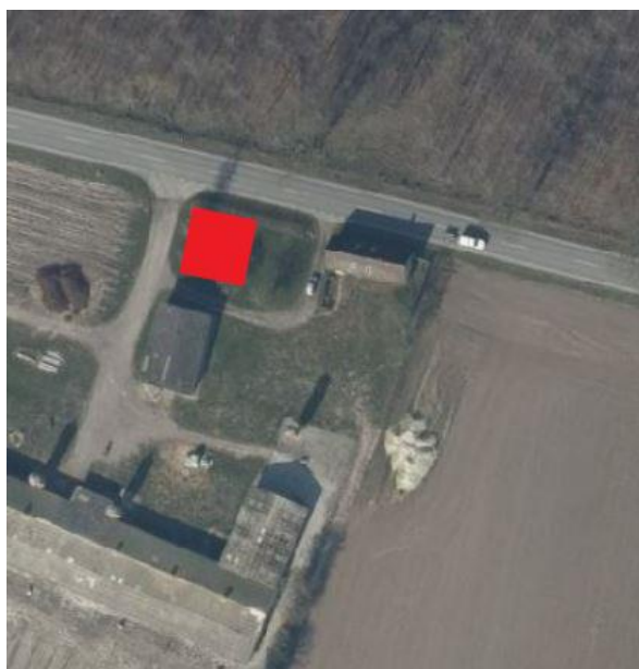
Placeringen af det ansøgte er markeret med rødt.

TELEFONTIDER: MAN-ONS KL. 9:00-11:00 TORS KL. 15:00-17:00 FRE KL. 9:00-11:00