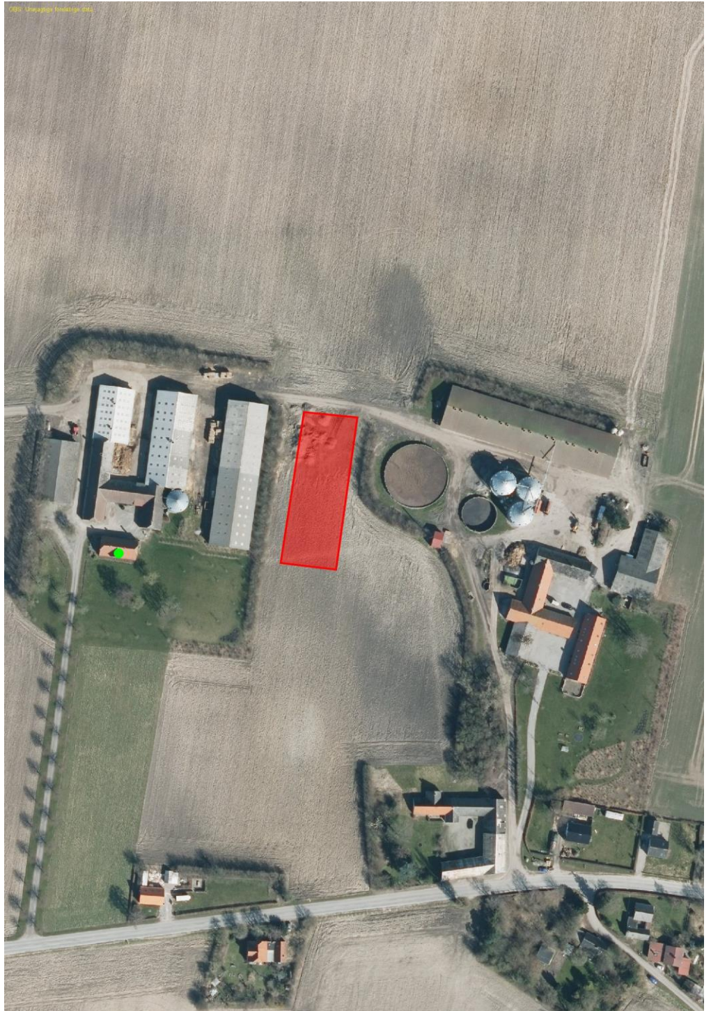
Luffoto af Bønnetvej 23 og Bønnetvej 29 m.fl. og ca. placering af ansøgt maskinhal